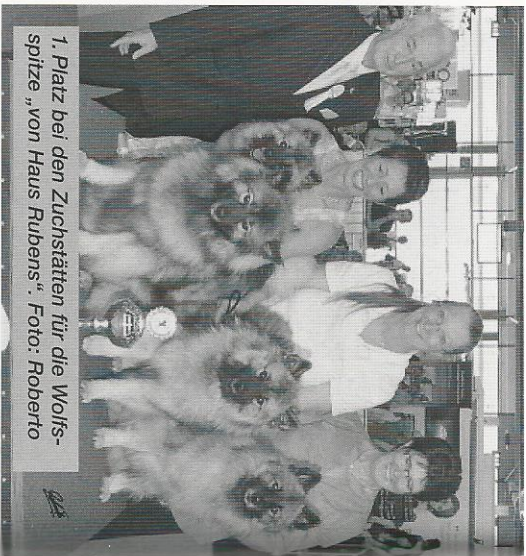
1. Platz bei den Zuchtstätten für die Wolfspitze „von Haus Rubens“.